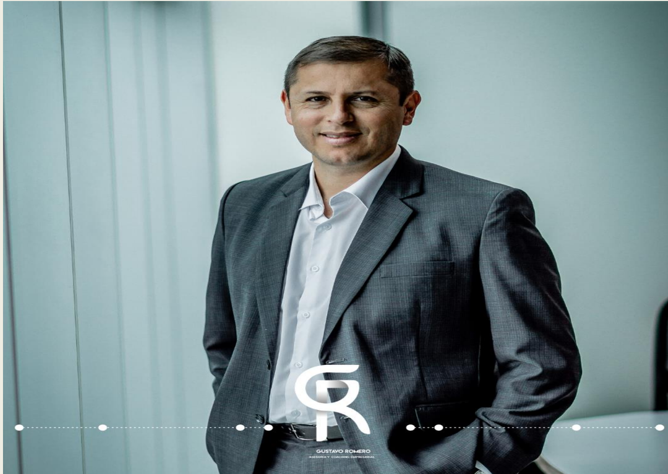
GUSTAVO ROMERO AGENCIAY CORCING EMPRESARIAL